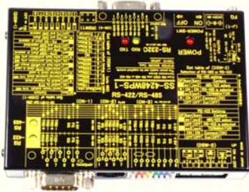
型名:SS-4248WPS-1 ACアダプタタイプ(AC100-240V DC5V) 価格:34,430円(税込)(本体価格:31,300円+消費税)