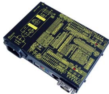
SS-iD4W485i-422-WPCA-AC (AC90~240V 電源使用) 価格:43,890 円(税込) (本体価格:39,900 円+消費税)