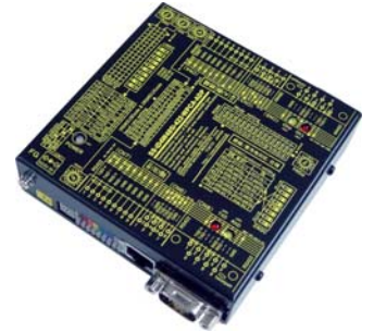
SS-iD4W485i-422-WPCA-ADP (AC アダプター電源使用) 価格:41,580 円(税込) (本体価格:37,800 円+消費税)