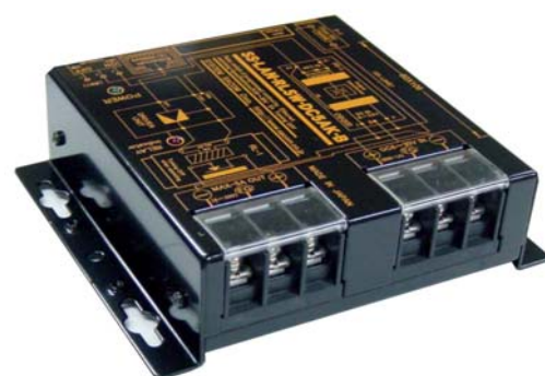
SS-LAN-RLSW-DC5AK-B 価格:41,580 円(税込) (本体価格:37,000 円+消費税)