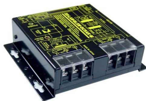
SS-LAN-RLSW-DC5AK-M 価格:41,580 円(税込) (本体価格:37,800 円+消費税)