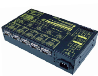
USB-232C-422TW5-AC-U 価格:121,000 円(税込) (本体価格:110,000 円+消費税)

35 ポート/7 段 : USB-232C-422TW35-AC(DC)-U 189(H)mm 302,500 円(税込)