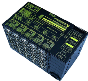
USB-232C-422TW30-AC-U 価格:272,250 円(税込) (本体価格:247,500 円+消費税)