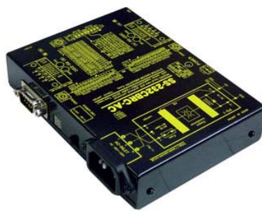
SS-232CBRC-AC AC 電源仕様 価格:41,580 円(税込) (本体価格:37,800 円+消費税)