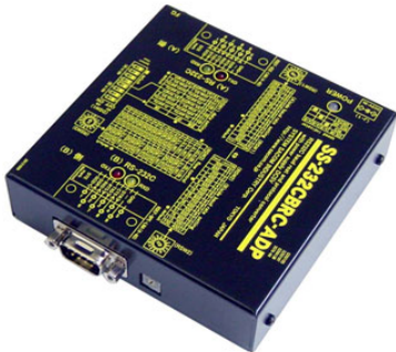
SS-232CBRC-ADP AC アダプタ仕様 価格:37,950 円(税込) (本体価格:34,500 円+消費税)