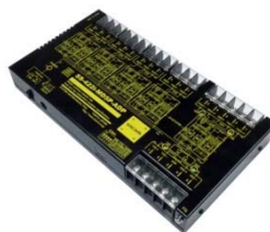
SS-422i-MD5P-ADP (AC アダプタ仕様) 価格: 75,900 円(税込) (本体価格: 69,000 円+消費税)