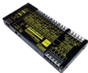
SS-422i-MD5P-DC (DC10~32V 仕様) 価格: 79,200 円(税込) (本体価格: 72,000 円+消費税)