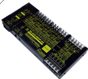
SS-422i-MD5P-AC (AC90~250V 仕様) 価格: 79,200 円(税込) (本体価格: 72,000 円+消費税)