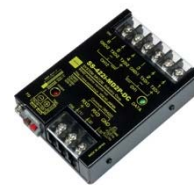
SS-422i-MD2P-DC (DC10~25V 仕様) 価格: 38,500 円(税込) (本体価格: 35,000 円+消費税)