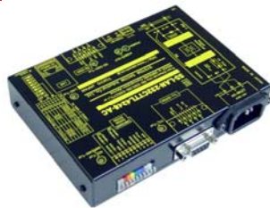
SS-LAN-232CTTL4248-AC 価格:57,200円(税込) (本体価格:52,000円+消費税)