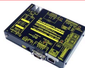
SS-LAN-232CTTL4248-DC 価格:57,200円(税込) (本体価格:52,000円+消費税)