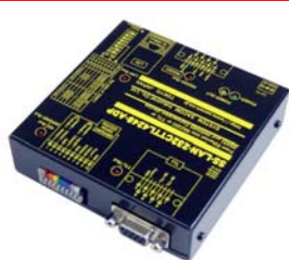
SS-LAN-232CTTL4248-ADP 価格:55,000円(税込) (本体価格:50,000円+消費税)