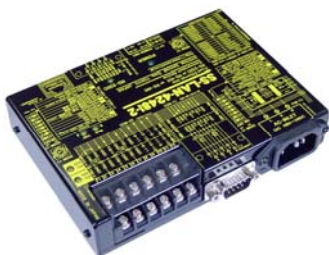
SS-LAN-4248I-2 価格:57,200 円(税込) (本体価格:52,000 円+消費税)