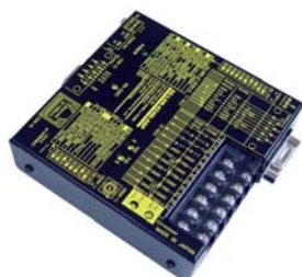
SS-LAN-4248I-ADP 価格:55,000 円(税込) (本体価格:50,000 円+消費税)