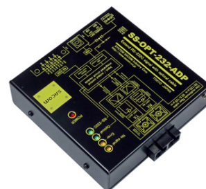
SS-OPT-232-ADP (ACアダプタ仕様) 価格: 48,400 円(税込) (本体価格: 44,000 円+消費税)