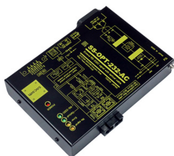
SS-OPT-232-AC (AC90~250V 仕様) 価格: 49,500 円(税込) (本体価格: 45,000 円+消費税)