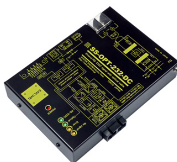
SS-OPT-232-DC (DC10~32V 仕様) 価格: 49,500 円(税込) (本体価格: 45,000 円+消費税)